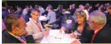
« Comment penser mon entreprise autrement », tel était le thème de la dernière plénière Plato Bretagne (13 octobre 2011 - St-Brieuc)

En Bretagne, le réseau Plato a déjà fidélisé plus de 400 chefs d'entreprises et représente à lui seul 30 % du réseau national.